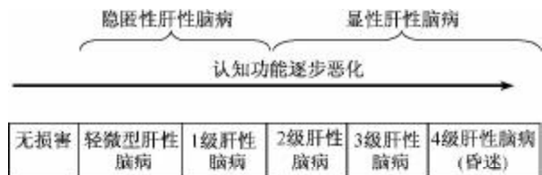
图1 West-Haven 分级与 SONIC 分级的对应关系

由于 West-Haven 分级标准很难区别0级和1级,特别是1级肝性脑病中,欣快或抑郁或注意时间缩短等征象难以识别。因此,近年 ISHEN 指南认为,慢性肝病患者发生肝性脑病是一个连续的过程,因此又制定了称为 SONIC 的分级标准,即将轻微型肝性脑病和 West-Haven 分级1级的肝性脑病归为“隐匿性肝性脑病(covert hepatic encephalopathy, CHE)”,其定义为有神经心理学和(或)神经生理学异常但无定向力障碍、无扑翼样震颤的肝硬化患者。将有明显肝性脑病临床表现的患者(West-Haven 分级标准中的2、3和4级肝性脑病)定义为“显性肝性脑病(overt hepatic encephalopathy, OHE)” [7] ,但是在中国缺乏应用经验,因此本共识仍按轻微型肝性脑病和肝性脑病分类。(编者注:在符合 West-Haven 分级标准1级的患者中,大部分无扑翼样震颤,按 SONIC 分级标准属于 CHE;少部分有扑翼样震颤,按 SONIC 分级标准属于 OHE。两种分级方式的大致对应关系见图1和表4。)